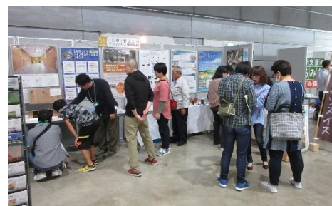
インキュベーションセンター入居者の活動発表