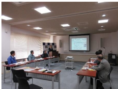
IMによるプレゼンテーション

当機構といたしましても、少しでも企業の皆様方のお役に立てるよう努めて参りたいと思います。ありがとうございました。