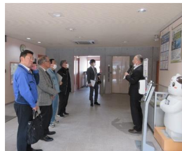
展示コーナーでの説明