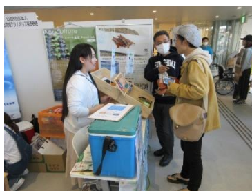
鯉を使った6次化製品販売(鯉とば)