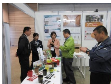
バイオマスプラスチック製品勢揃い