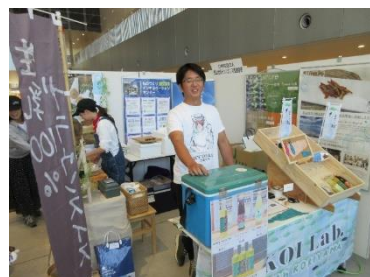
開発したエナジードリンクの販売