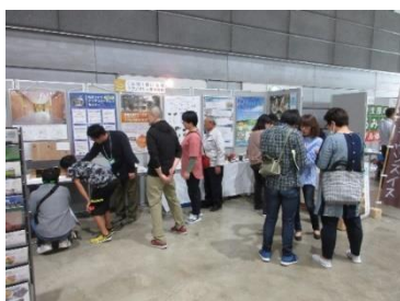
入居者の展示物説明に集まる来場者