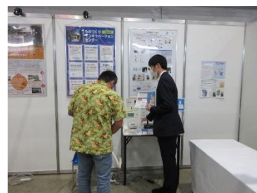
開発した節電システムの説明