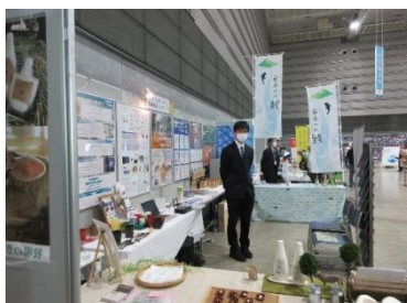
準備が終わり来場者を待つだけ