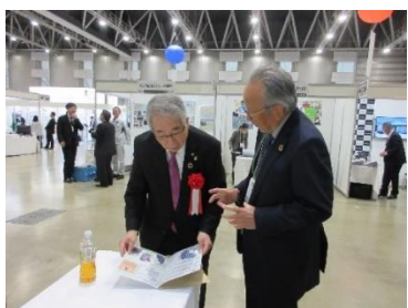
低温熱分解装置に興味あり

期 日：令和5年10月12日(木)・13日(金) 会 場：ビッグパレットふくしま