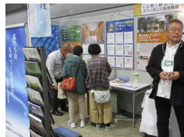
入居者の研究開発について説明