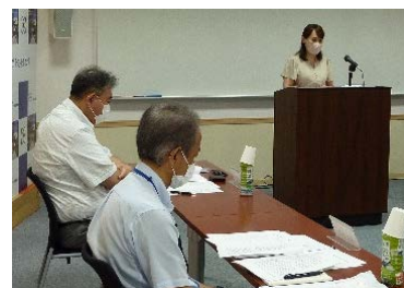
技術等審査委員会の様子