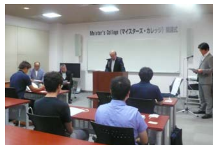
開講式 主催者挨拶

なお、「マイスターズ・カレッジ2018」は平成30年10月30日(火)まで各コースに分かれ開催します。