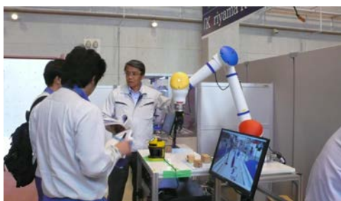
ロボット実機による説明