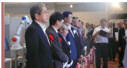
関係者によるテープカット

当機構では、今後も県内外よりご相談にお出でいただいた企業の皆様を地域ロボットSIとともにフォローし、生産の自動化による「生産性の向上」、「人材不足の解消」に貢献していきます。