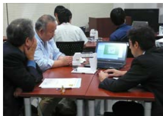
小型マニピュレータに作業を指示