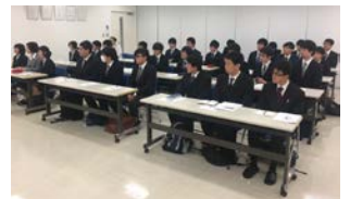
真剣な眼差しで説明を聞く学生たち（林精器製造）