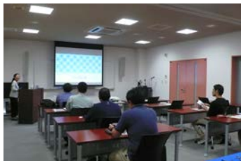
ご協力いただいた

今回のマイスターズ・カレッジは総勢15名が参加し、13人が無事に修了証書を受け取りました。