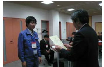
修了証書を受け取る受講生