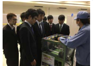
安全対策について説明いただきました（TBK）

学生らは、製品紹介や企業概要説明、工場内の見学を終え、質疑応答の時間を設けると間髪いれず質問が続き、あっという間に予定の1時間30分が過ぎていきました。ある担当者からは「学生の本気が伝わりました。ぜひ、採用試験を受けてもらいたい」との話がありました。