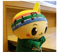
ガクトくんも応援に駆けつけてくれました