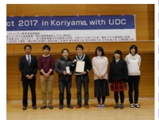
郡山市長賞受賞 Team エフスタ!!