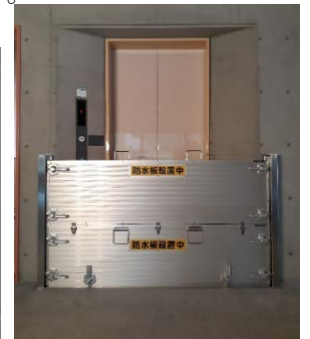
防水板を取付けた状態