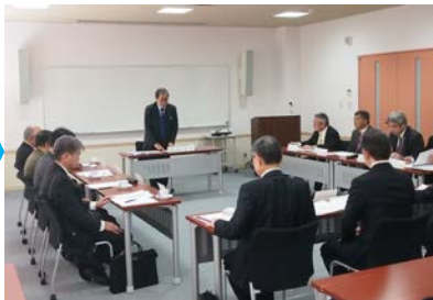
復旧した会議室にて理事会を開催しました