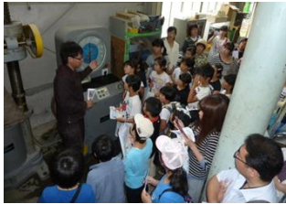
コンクリート破壊実験