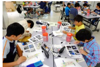
IchigoJamを組み立てる子供たち