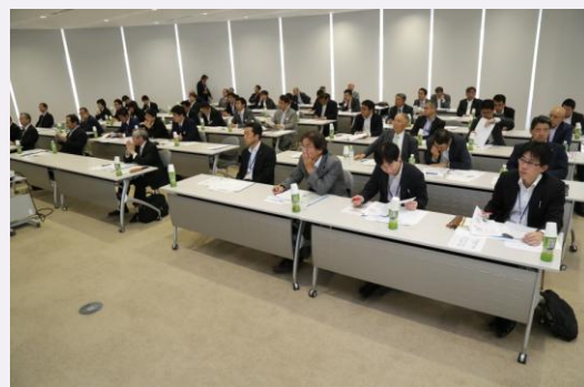
前回の企業製品等発表会の様子