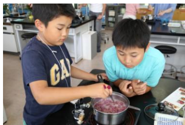
人気のバラジャム作り