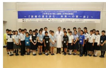
日本大学での記念撮影