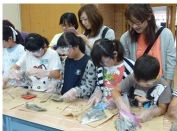
コンクリート流し込み