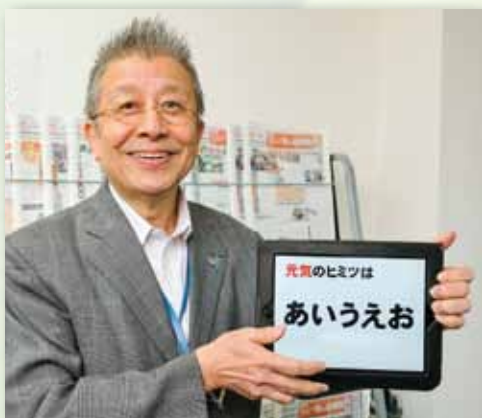
有限会社産業情報化新聞社 代表取締役 (日本一明るい経済新聞編集長)