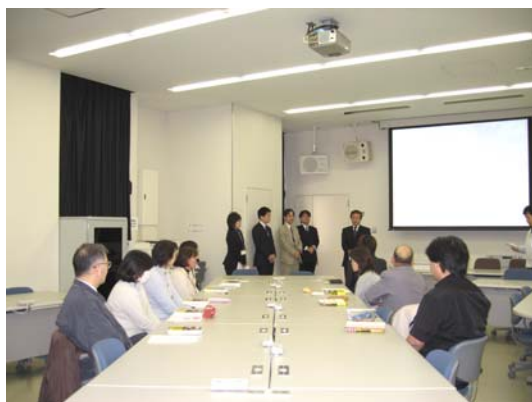
開講式に臨む受講者のみなさん

しかしながら、あまり勉強にならなかったという方や、最終日にご出席いただけなかった方もいたので、講座の内容や日程など次回以降の反省点とし、参加いただいた方全員が満足いただけるよう講座等を今後企画、開催できればと思います。