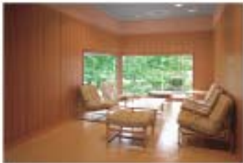
■ ロビー (西側)