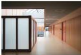
■ コピーコーナーと廊下