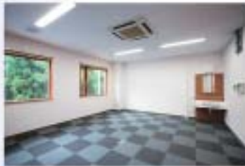
■ 起業支援室 (事務室タイプ)