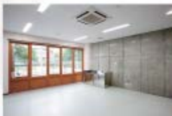
■ 起業支援室 (実験室タイプ)